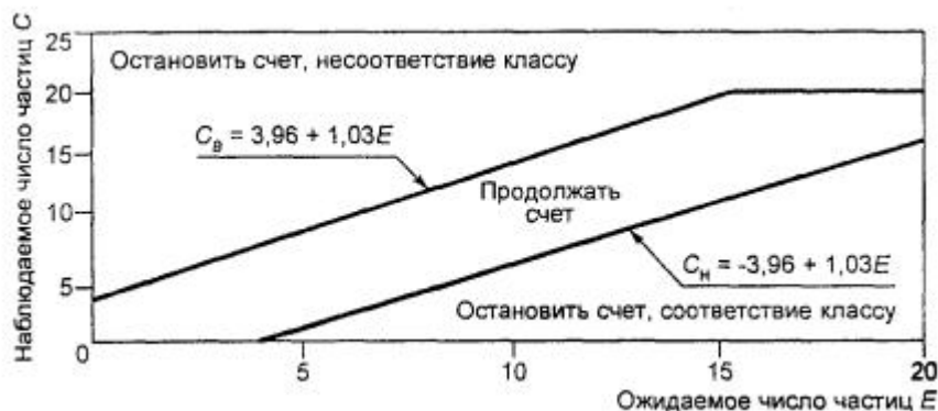
Рисунок F.1 - Границы соответствия и несоответствия классам чистоты при использовании метода последовательного отбора проб

На рисунке F.1 по оси абсцисс отложены значения ожидаемого числа частиц E , если концентрация частиц равна максимально допустимому значению для заданных размеров частиц и класса чистоты (В.4.2). По оси ординат отложены значения наблюдаемого числа частиц C в пробе.